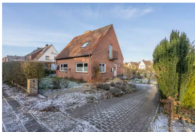
Zufahrt, bestehendes Haus