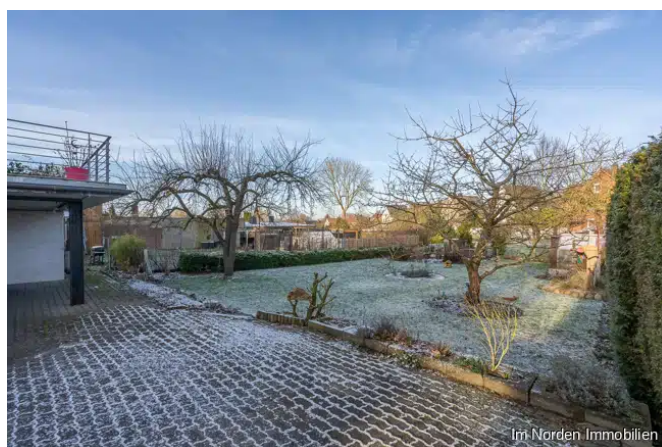
Blick auf das Grundstück