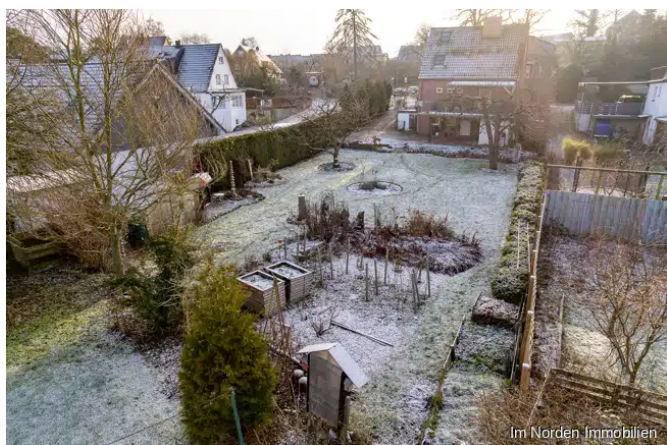
Blick zum bestehenden Gebäude