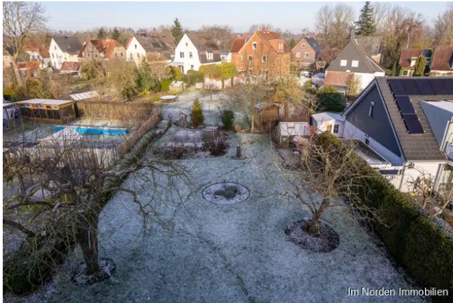
Grundstück, Blick vom vorhandenen Haus