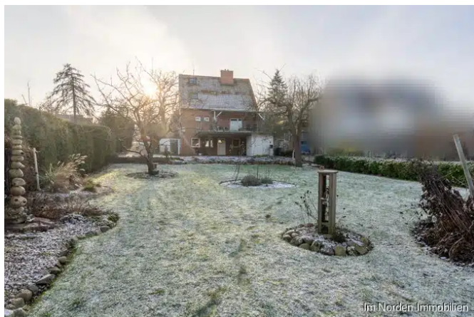
Blick zum Bestandsgebäude