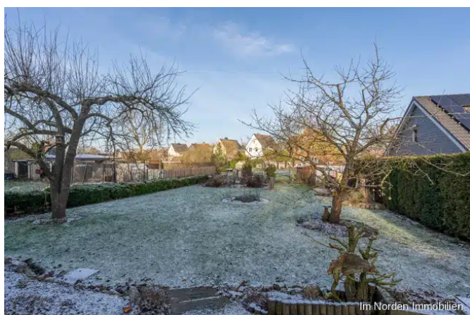
Blick auf das Grundstück