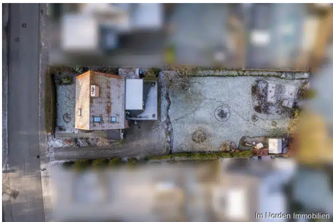
gesamtes Grundstück von oben