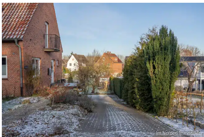
gemeinsame Zufahrt zum Baugrundstück