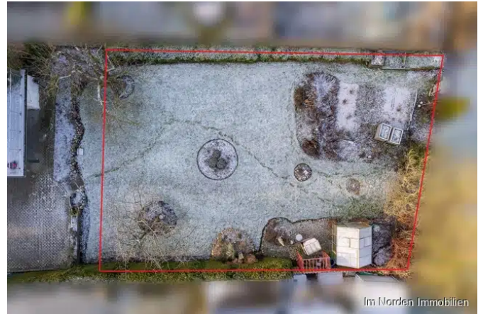
zukünftiger Zuschnitt des Baugrundstücks