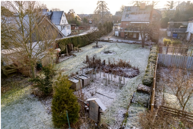
Blick zum bestehenden Gebäude