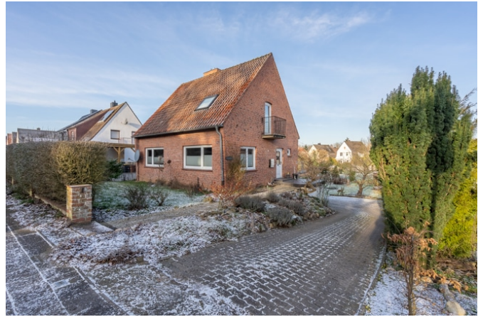
Zufahrt, bestehendes Haus