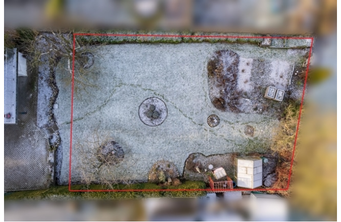
zukünftiger Zuschnitt des Baugrundstücks