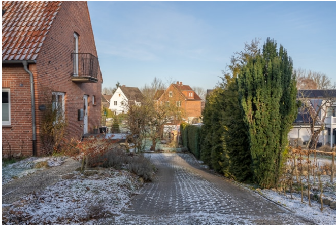
gemeinsame Zufahrt zum Baugrundstück