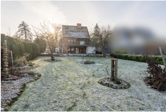
Blick zum Bestandsgebäude