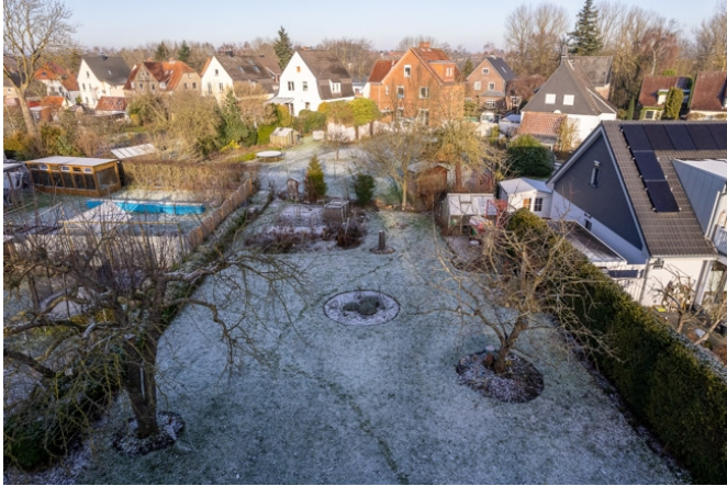
Grundstück, Blick vom vorhandenen Haus