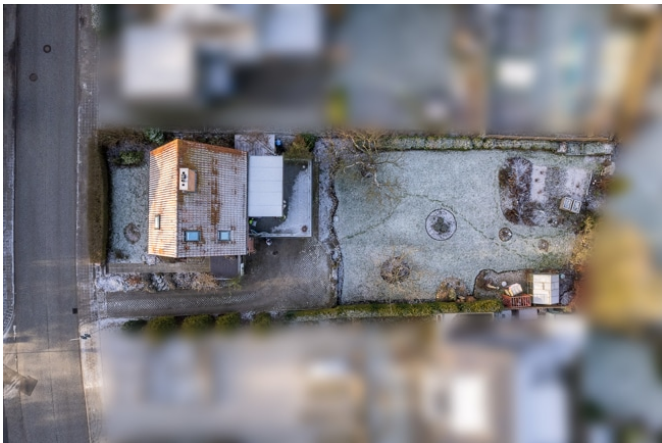
gesamtes Grundstück von oben