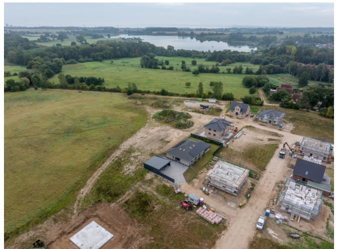
Blick zum Süseler See