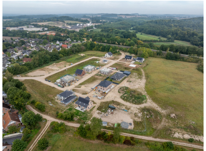
Blick über das Baugebiet