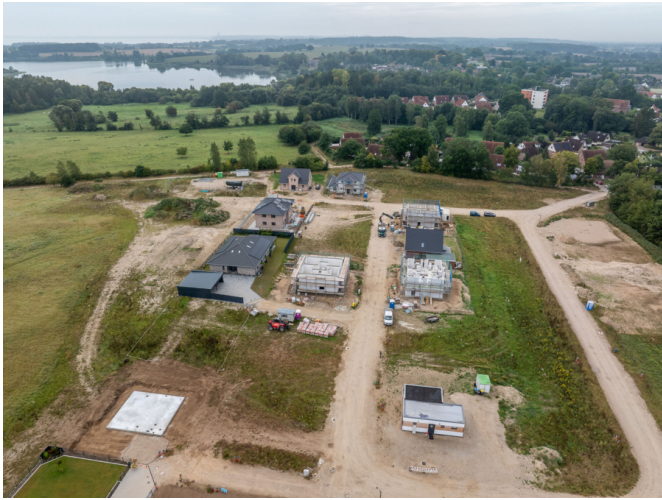
Ostsee im Hintergrund