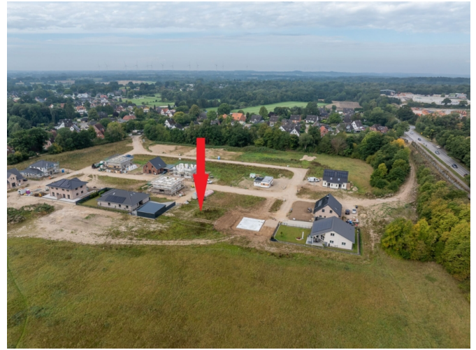
Lage des Baugebietes