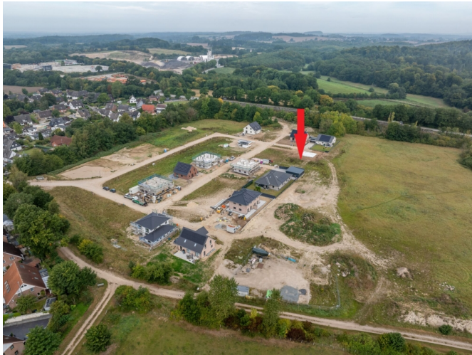
Blick über das Baugebiet