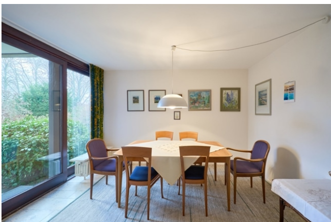
Esszimmer mit Gartenblick