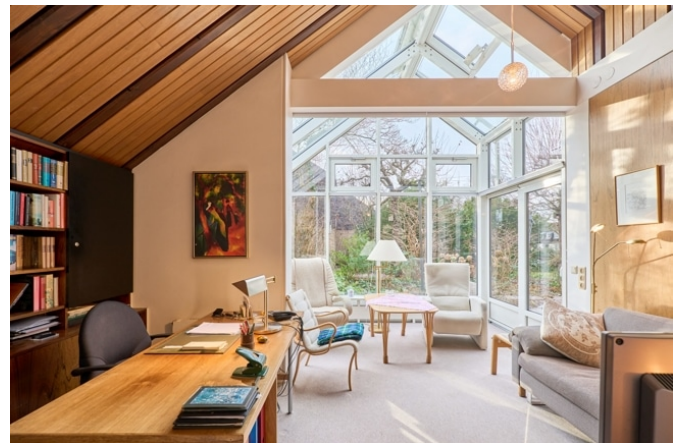
Arbeitszimmer mit Wintergarten