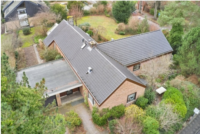
Blick aus der Vogelperspektive