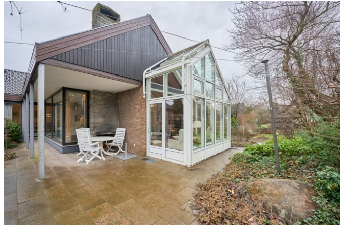
Terrasse mit Wintergarten