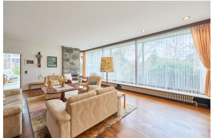
Wohnbereich mit großer Fensterfront