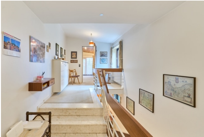
Flur zum Schlafzimmer