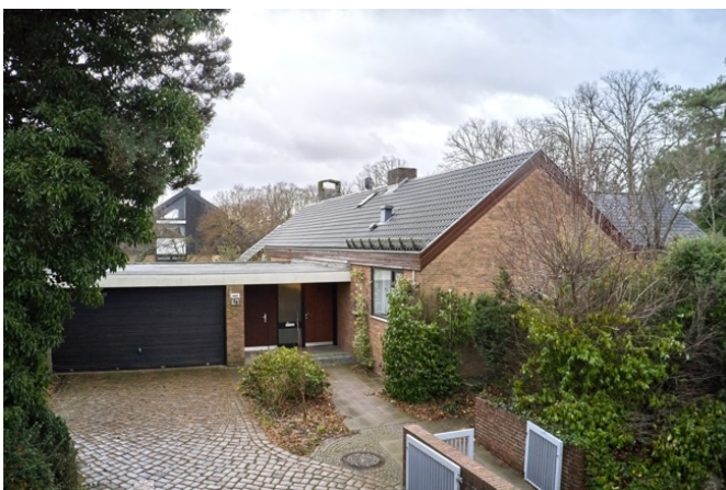
Zufahrt und Eingangsbereich