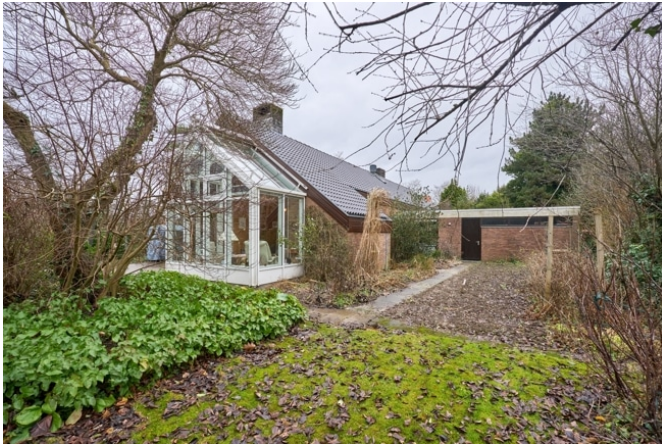
hinterer Gartenbereich mit Zugang zur Garage