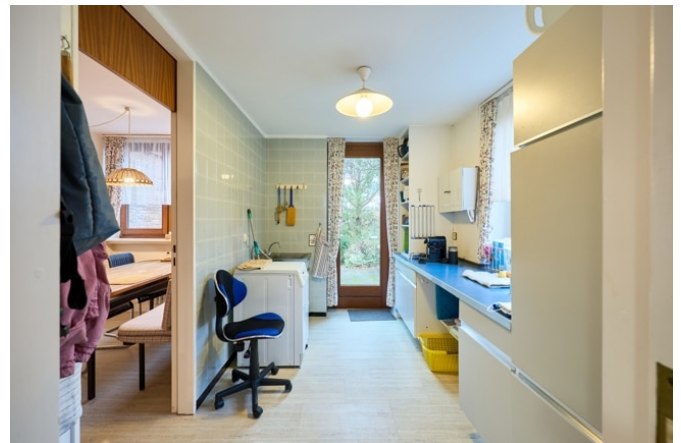
Hauswirtschaftsraum mit Ausgang