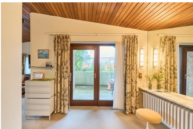
Balkon am Schlafbereich