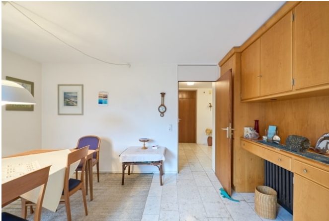
Einbauschränke im Essbereich