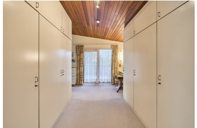
Einbauschränke im Schlafbereich