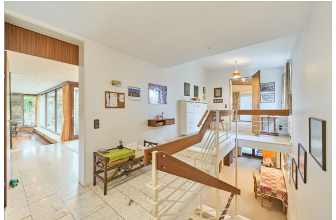
Flur zu den Schlafbereichen