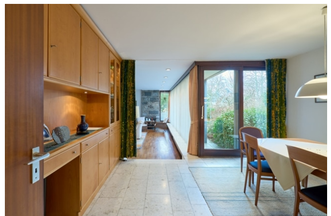
Esszimmer mit Blick zum Wohnzimmer