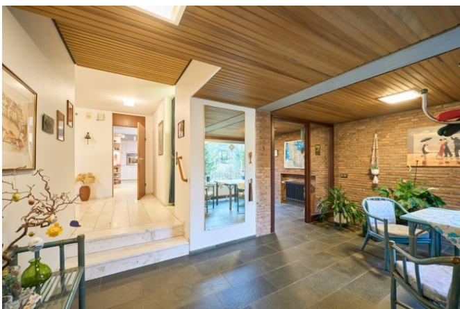
Diele mit Blick zur Küche