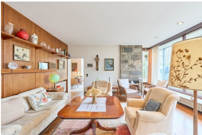
Einbauschränke im Wohnbereich