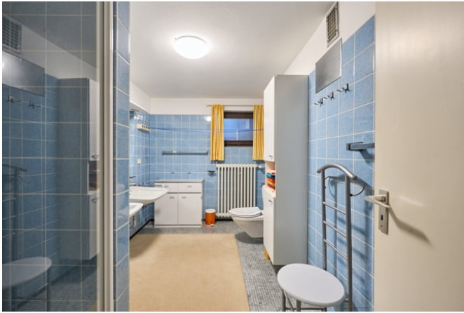
Bad im Souterrain