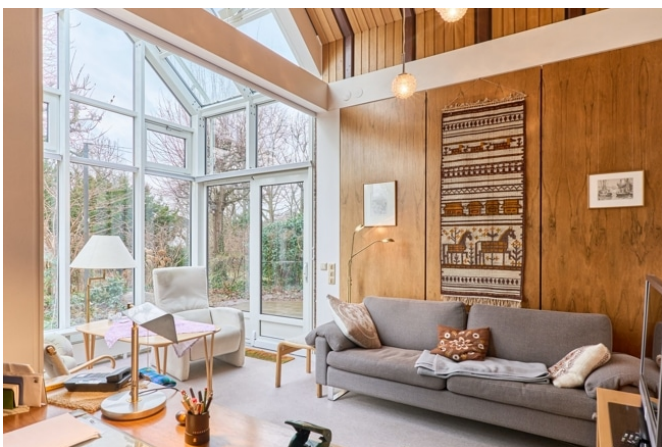
Sitzecke im Wintergarten.