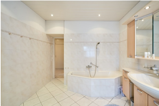
Hauptbad mit Wanne