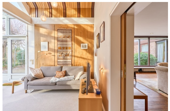
Sitzecke im Wintergarten