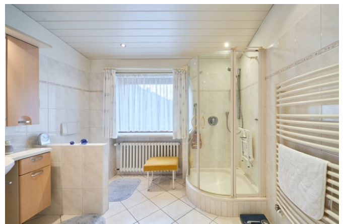
Hauptbad mit Dusche