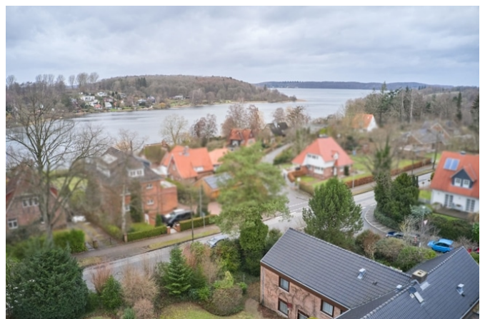
Blick zum Kellersee