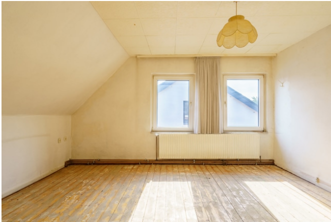
Zimmer 1 im DG