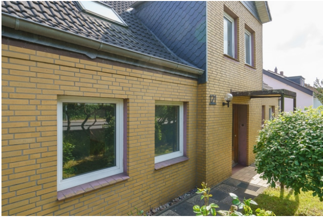
Zuwegung zum Hauseingangeingang