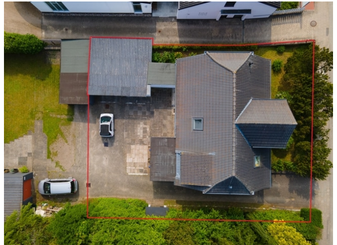
Hausansicht von Oben