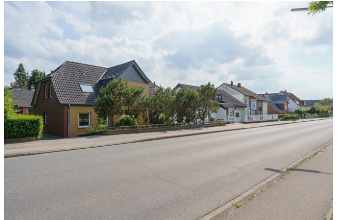
Blick von der Plöner Straße