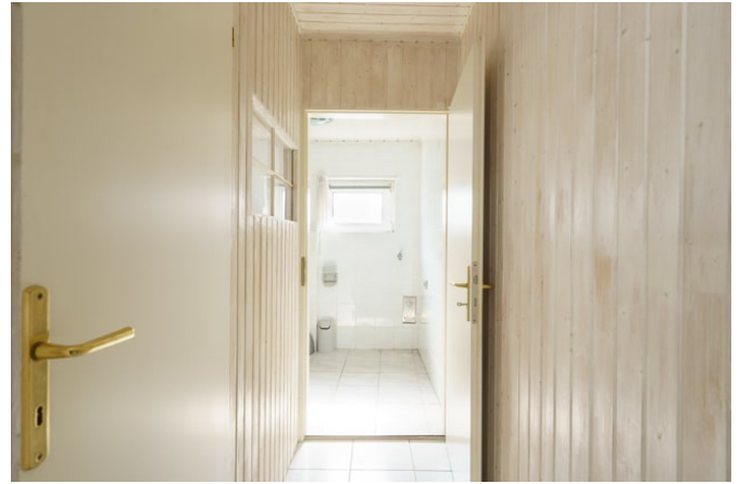
Flur zum Badezimmer