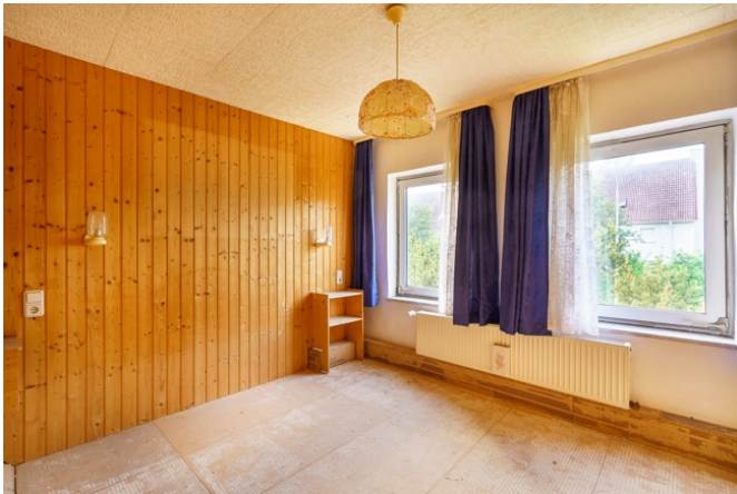
Zimmer 3 im DG