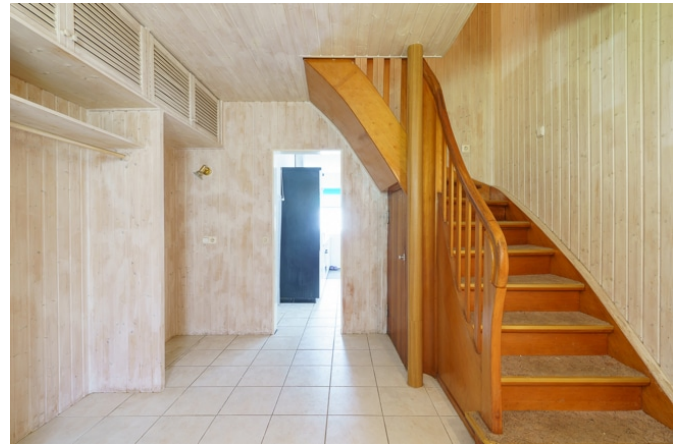
Diele mit Treppe zum Dachgeschoss