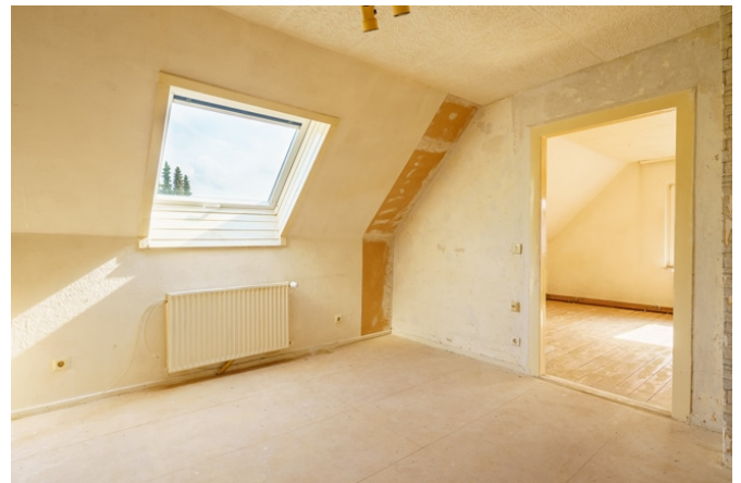
Zimmer 2 im DG