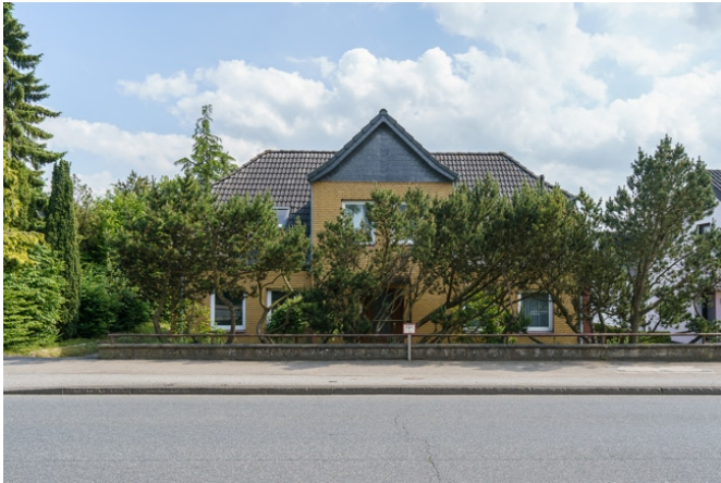
Hausansicht von der Plöner Straße