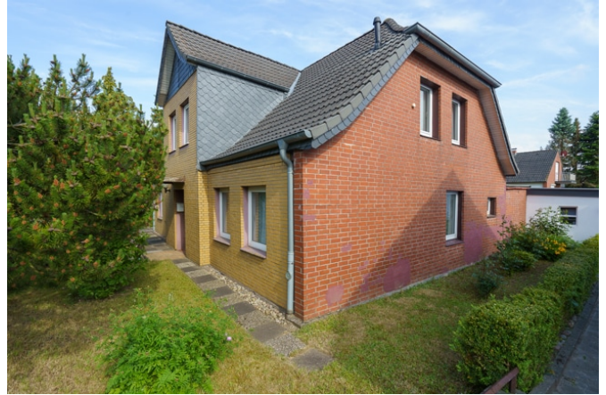
Seitenansicht von der Plöner Straße