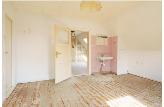
Zimmer 1 im DG