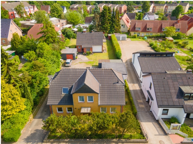
Hausansicht von Oben