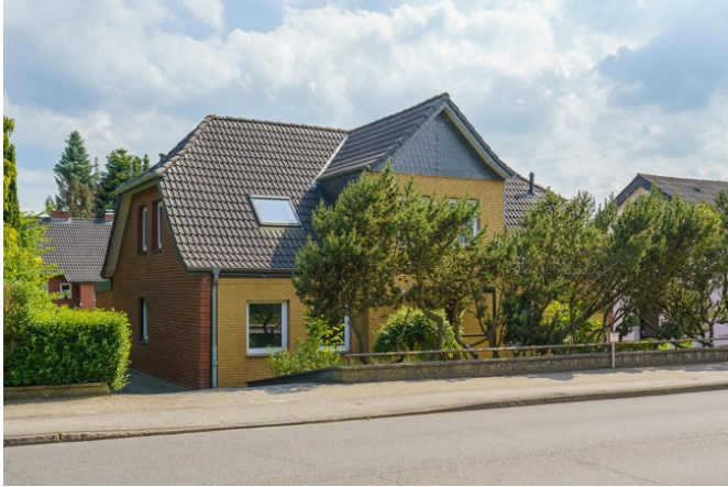
Hausansicht von der Plöner Straße