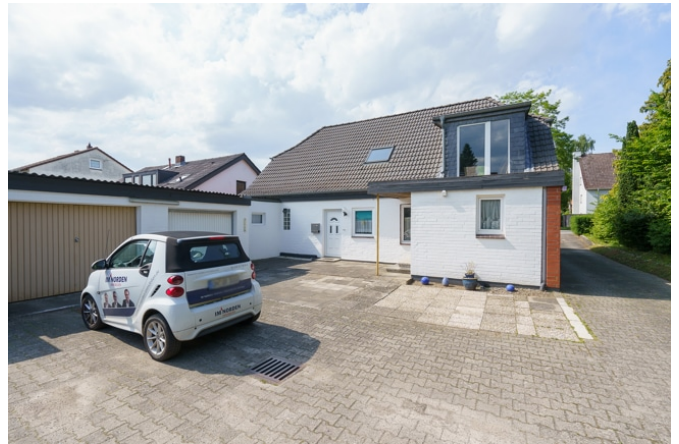
Hausansicht vom Grundstück