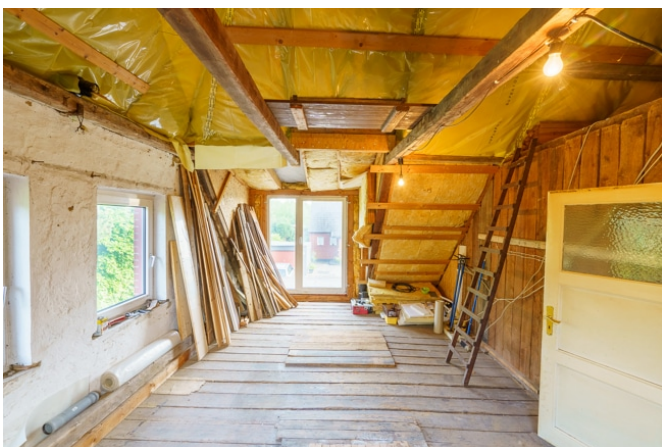
Zimmer 4 im DG