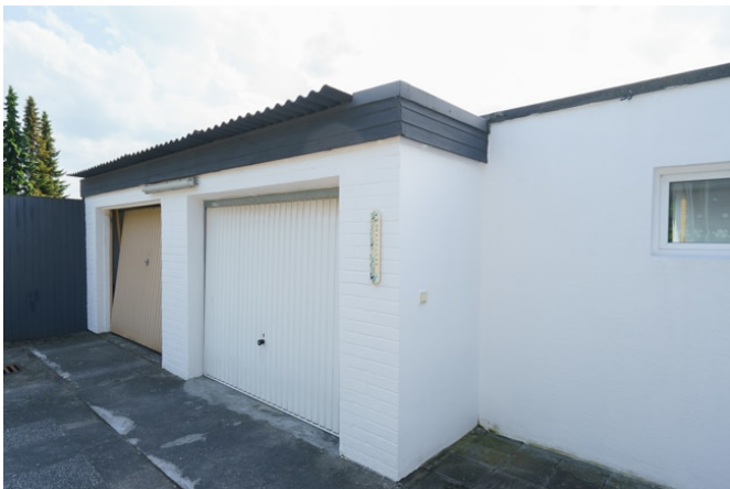
Blick auf die Garagen