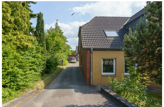
Zuwegung auf das Grundstück