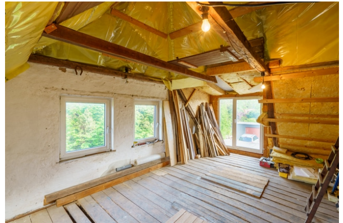
Zimmer 4 im DG