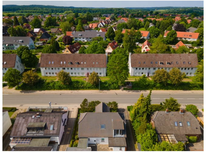
Hausansicht von Oben