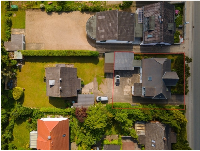
Hausansicht von Oben