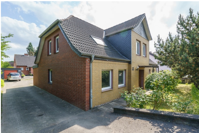
Seitenansicht von der Plöner Straße