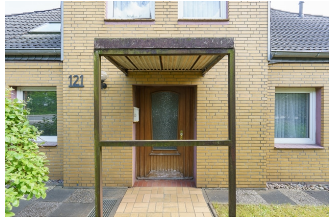
Hauseingang von der Plöner Straße