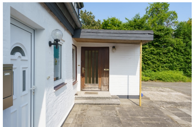
Hauseingang zur Whg.2