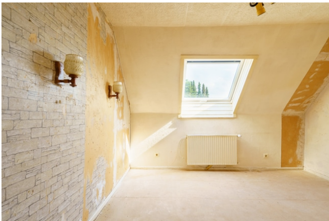
Zimmer 2 im DG