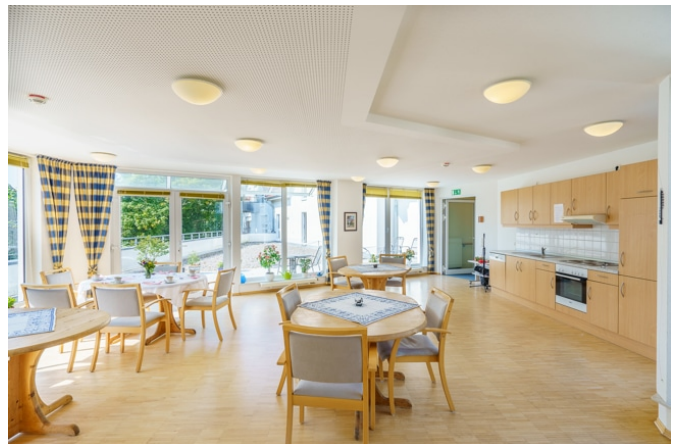
Gemeinschaftsraum mit Küche