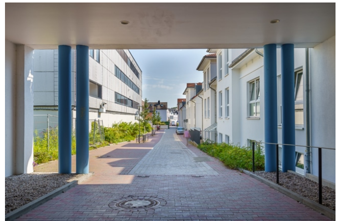
Durchgang vom Bahnhof in die Peterstraße