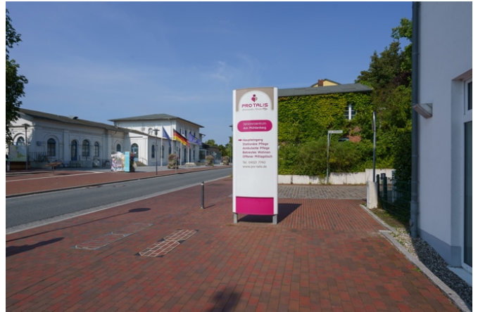
Blick auf den Bahnhof