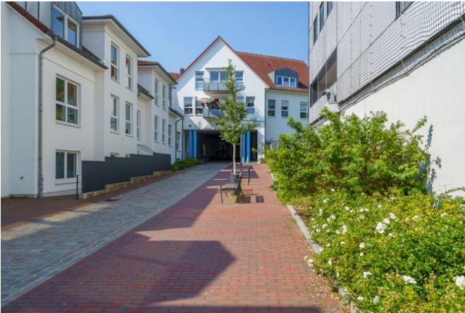
Durchgang zum Bahnhof