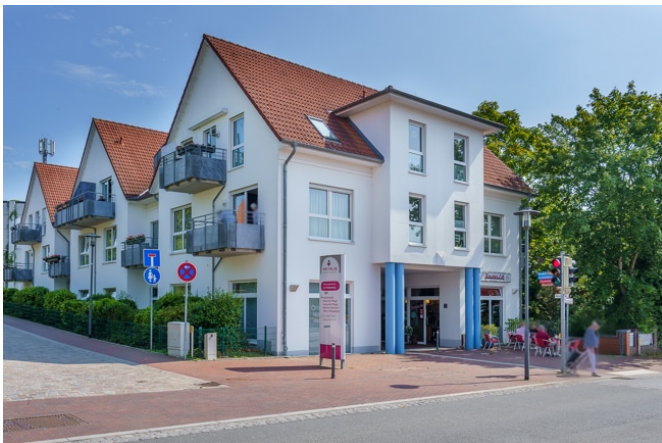
Ansicht vom Bahnhof