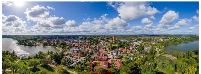
Lage von Eutin