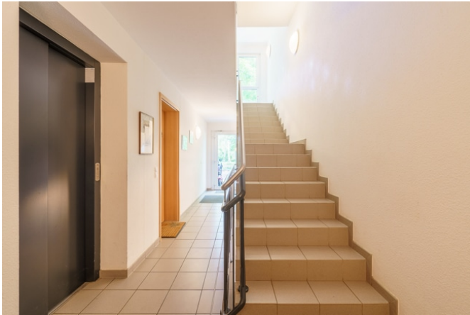
Fahrstuhl im Hausflur