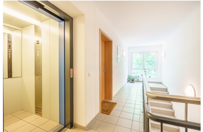
Wohnungseingang neben dem Fahrstuhl