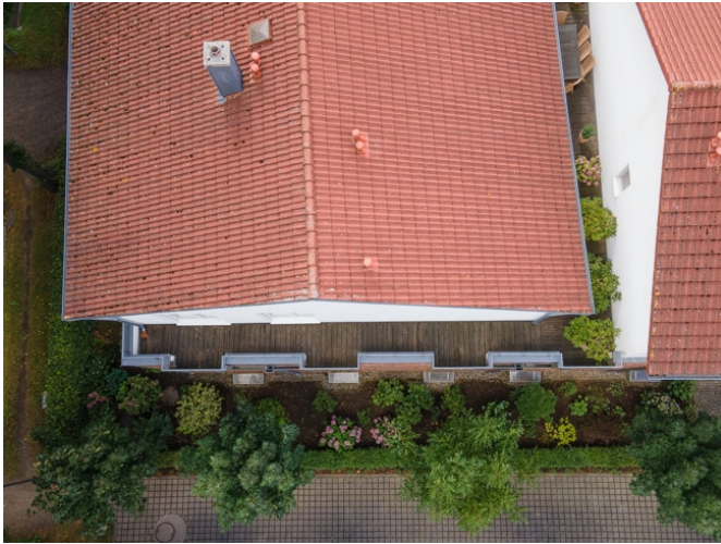
Dachterrasse von Oben