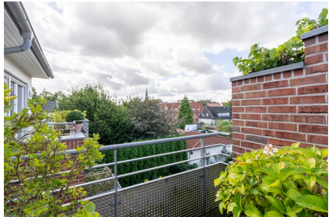
Blick von der Dachterrasse