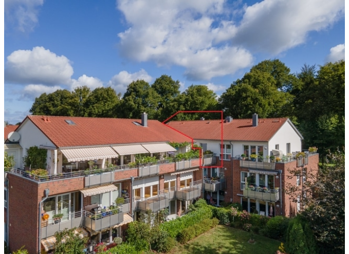
Ansicht von der Gartenseite