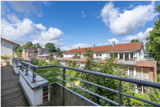
Blick von der Dachterrasse