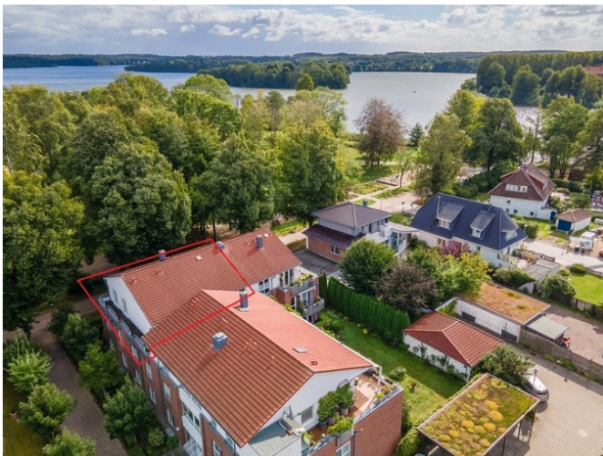
Lage der Penthouse-Wohnung