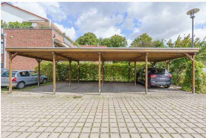
Stellplatz im Carport