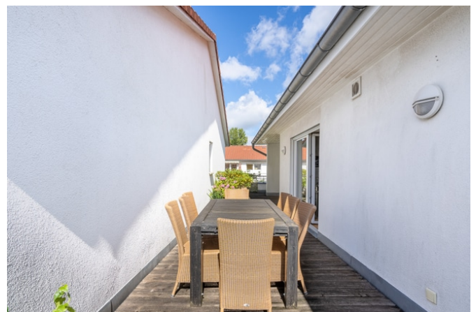
Essplatz auf der Dachterrasse