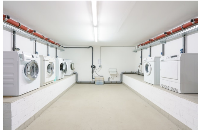
Waschraum im Keller