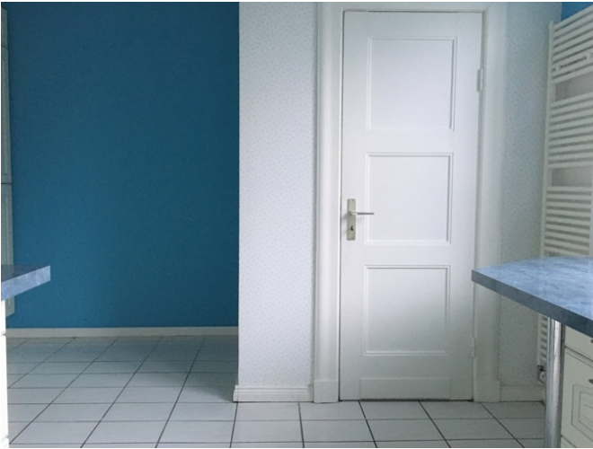
Küche mit Abstellkammer