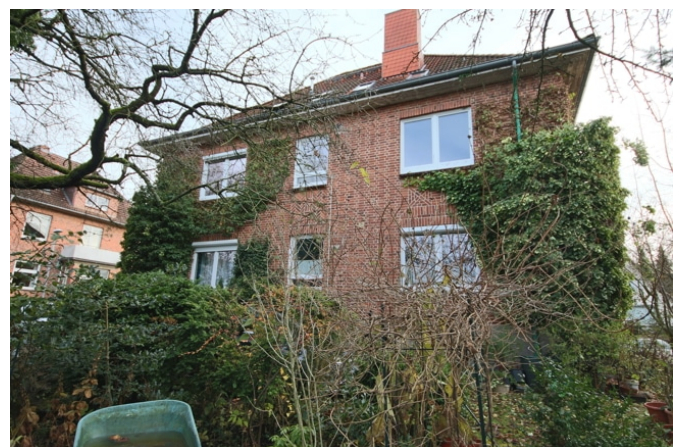
Wohnung Obergeschoss Gartenansicht