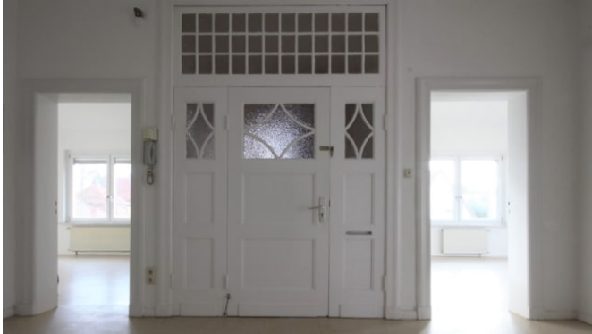
Eingangstür + Diele