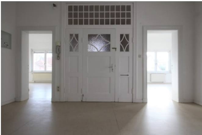
Eingangstür + Diele